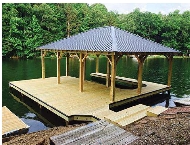
Рисунок 4. Варианты устройства пирса