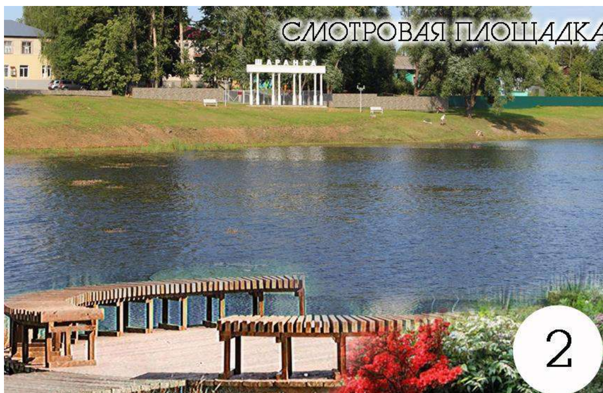
Рисунок 3. Смотровая площадка

Пляжная территория по проекту обеспечивается малыми архитектурными формами: шезлонгами, зонтами, кабинкой для переодевания, урнами.