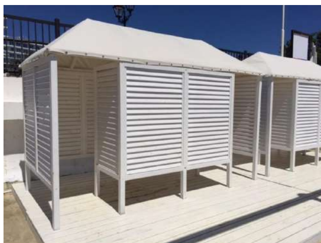
Рисунок 7. Варианты кабинок для переодевания