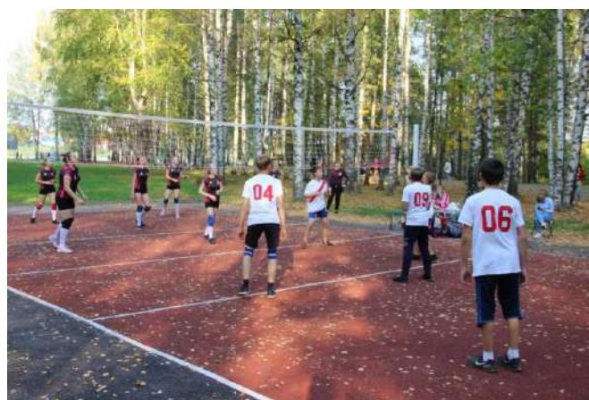
Рисунок 1. «Бабье лето» в Заречном парке

По завершению 2 очереди работ было проведено публичное мероприятие «Бабье лето» по приемке объекта с привлечением средств массовой информации.