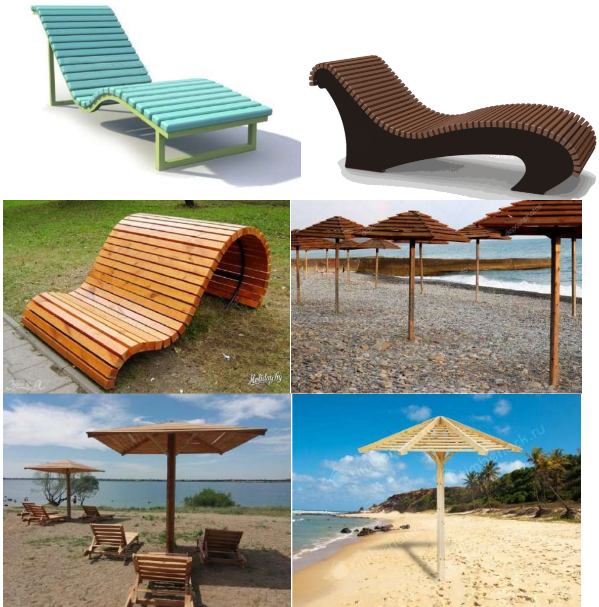
Рисунок 8. Шезлонги, скамьи и зонты для пляжа