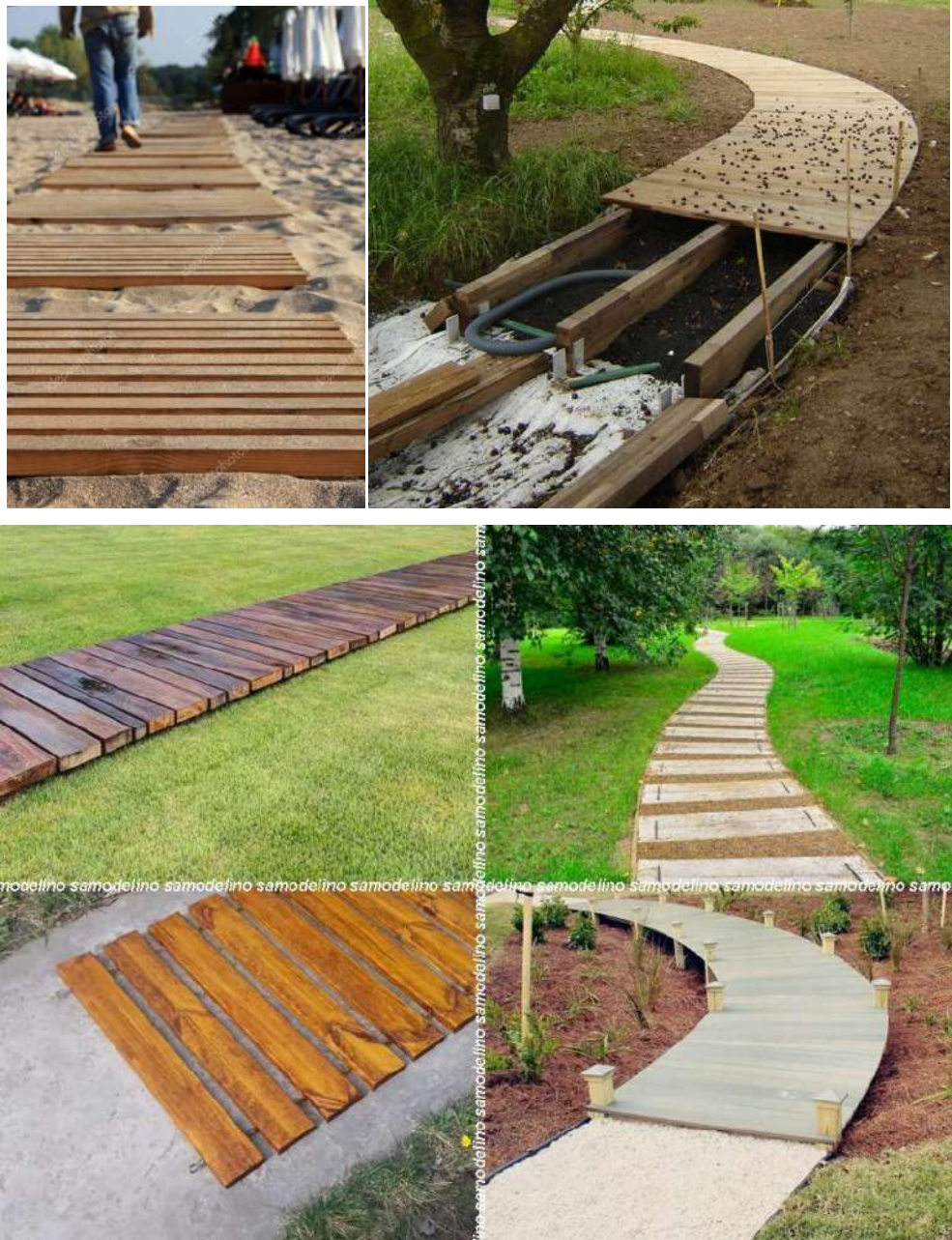
Рисунок 6. Деревянные дорожки для пляжа